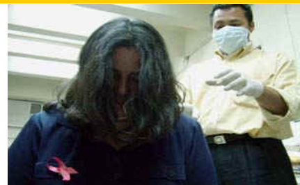
Para combatir la epidemia hay que sustituir la vergüenza por la solidaridad y el miedo por la esperanza

El Estigma y la Discriminación son provocados por la falta de conocimiento, los mitos sobre los modos de transmisión del VIH, los prejuicios, las dificultades para el tratamiento, el hecho de que el SIDA sea incurable, los miedos sociales en torno a la sexualidad y los miedos relacionados con la enfermedad y la muerte.