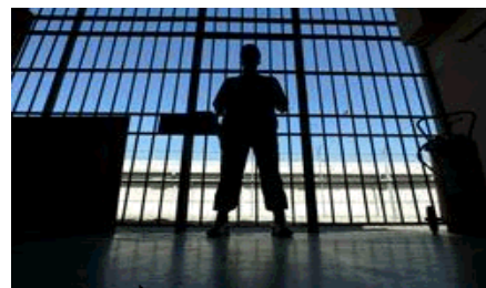
El que discrimina puede ir a prisión

Nos toca ahora velar por el cumplimiento de la ley.